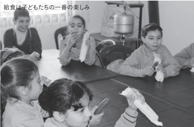
給食は子どもたちの一番の楽しみ